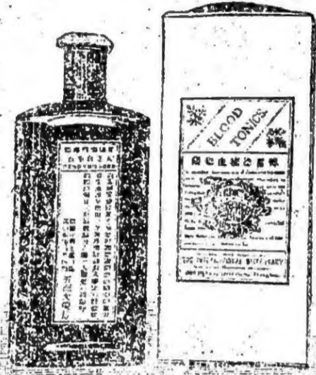
圖之橫裝式老售停

左圖乃舊式裝璜近因奸商以偽藥仿冒 希圖漁利茲定於七月一日起照左圖之 裝璜一律停售以便服者易分真偽而杜 假冒